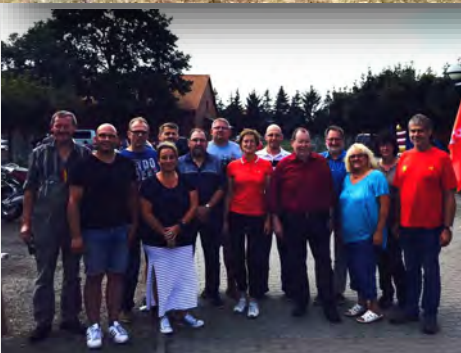
Links: Sommerfest SPD Osloß