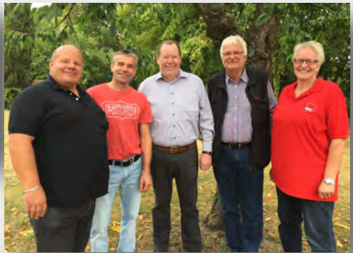
Links: Seit 50 Jahren in der Partei! Jubilarehrung der SPD in Lehre